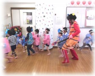
●2月3日 八幡西幼児音楽まつり