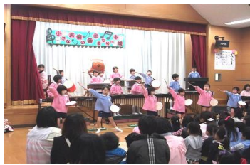
●2月12～23日 実習生 北九州女子短期大学1年生が実習にきました。絵本の読みかかせをしてもらいました。