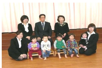
●2月8日(金) ひまわり組保育参観日

日頃の体操教室の姿をみていただきました。とび箱や台上前転など、元気いっぱい挑戦し、沢山の感動の声と拍手をいただきました。参観の後は給食の試食会です。